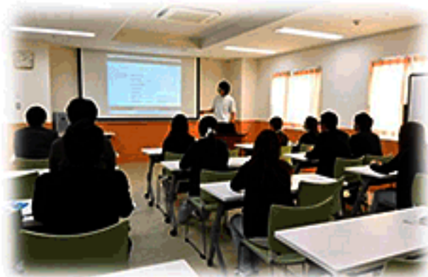
授業風景 (十全記念病院レクチャーホール)